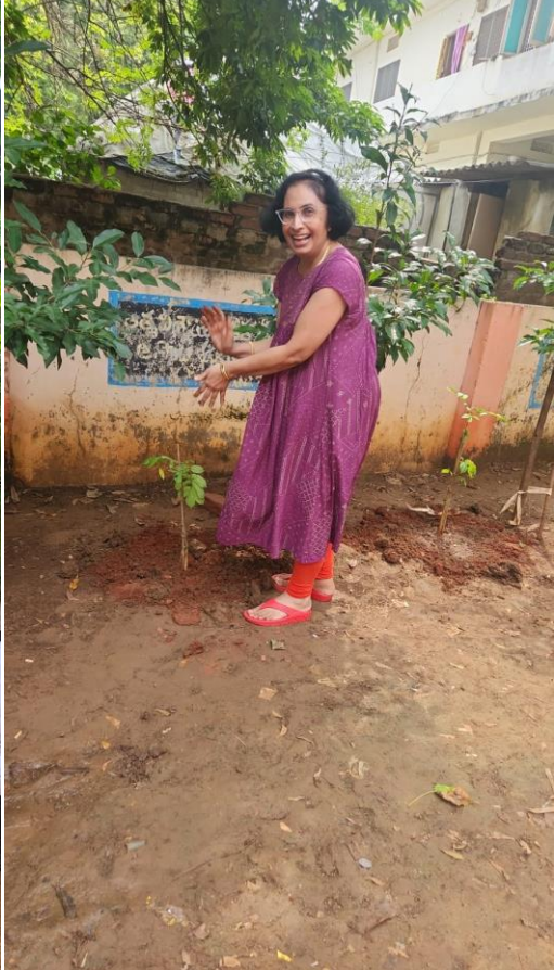
TREE PLANTATION AT PREMISES OF R.C.M.U.P.SCHOOL. KORETIPADU, GUNTUR ON 24.10.2024