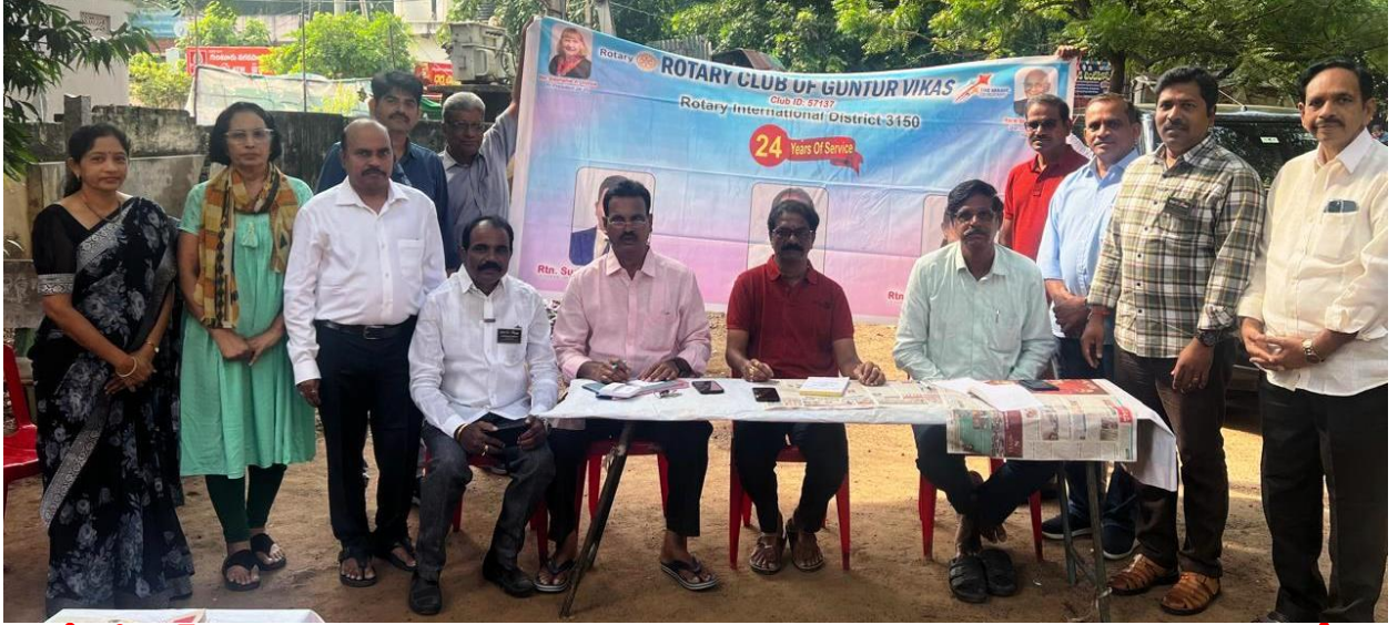
రోటరీ క్లబ్ ఆఫ్ గుంటూరు వికాస్, శంకర్ కంటి ఆసుపత్రి వైద్య నిపుణుల సహకారంతో, కొరెటిపాడు ఆర్.సీ.ఎం. అప్పర్ ప్రైమరీ స్కూల్ ఆవరణలో, 27.10.2024 ఆదివారం నాడు ఉచిత కంటి చికిత్సా శిబిరం నిర్వహించారు