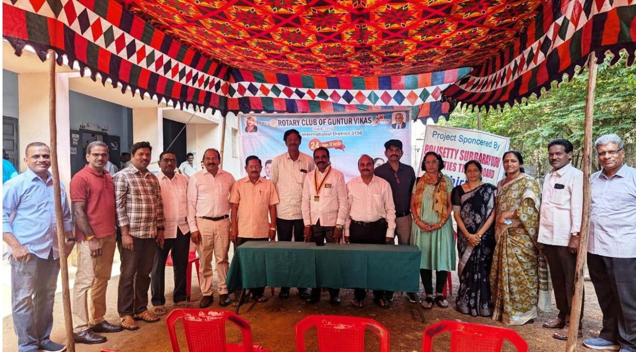
రోటరీ క్లబ్ ఆఫ్ గుంటూరు వికాస్, శంకర్ కంటి ఆసుపత్రి వైద్య నిపుణుల సహకారంతో, కొరెటిపాడు ఆర్.సీ.ఎం. అప్పర్ ప్రైమరీ స్కూల్ ఆవరణలో, 27.10.2024 ఆదివారం నాడు ఉచిత కంటి చికిత్సా శిబిరం నిర్వహించారు