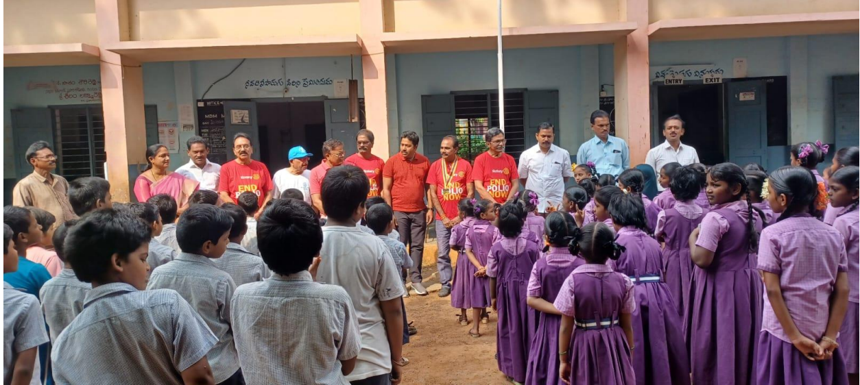
POLIO AWARENESS PROGRAMME CONDUCTED AT R.C.M.U.P.SCHOOL, KORETIPADU, GUMNTUR