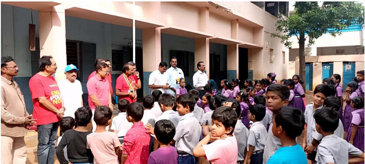
POLIO AWARENESS PROGRAMME CONDUCTED AT R.C.M.U.P.SCHOOL, KORETIPADU, GUMNTUR

India has been certified Polio free by the Regional Polio Certification Commission on the 27th March 2014.