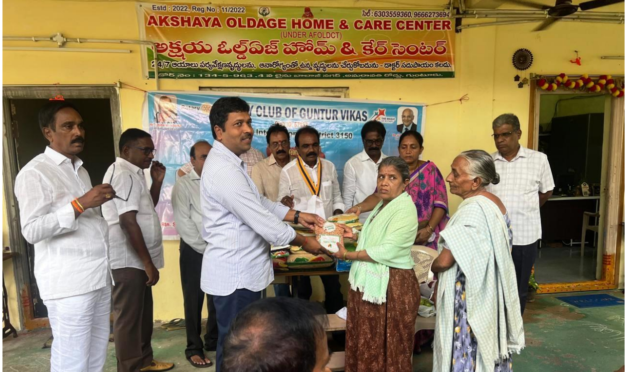
Service Project at Akshaya Old Age Home & Care Centre, Balaji Ngar, Amaravati Road, Guntur on 19th October, 2024