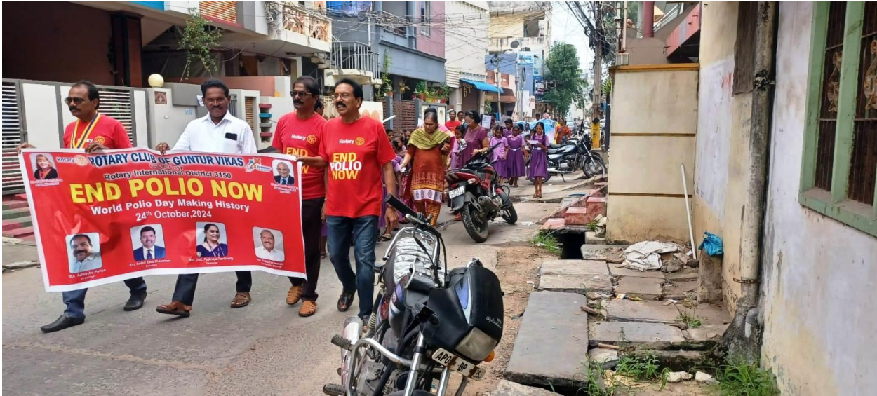
POLIO AWARENESS PROGRAM RALLY CONDUCTED AT KORETIPADU STREETS ON 24.10.2024 - WORLD POLIO DAY