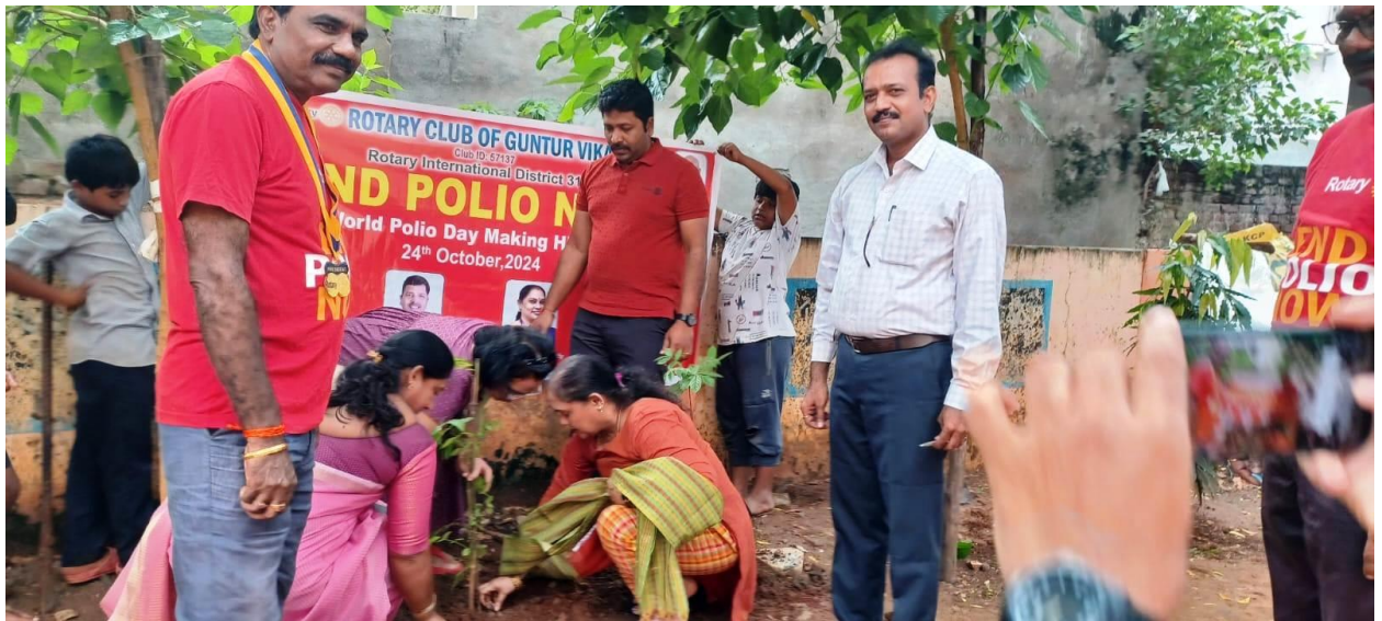
TREE PLANTATION AT PREMISES OF R.C.M.U.P.SCHOOL. KORETIPADU, GUNTUR ON 24.10.2024