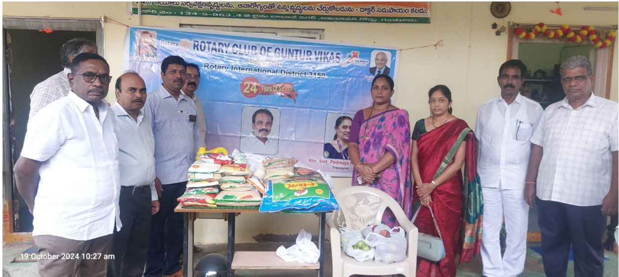
Service Project at Akshaya Old Age Home & Care Centre, Balaji Ngar, Amaravati Road, Guntur on 19th October, 2024