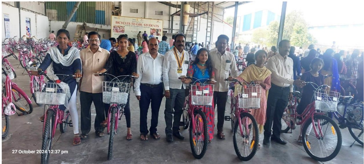
Five Bicycles were distributed to five school going girls by our Club on 27.10.2024 under "Bicycles to Girl Students" program, under RC OF HYDERABAD NORTH-VELJAN Project.