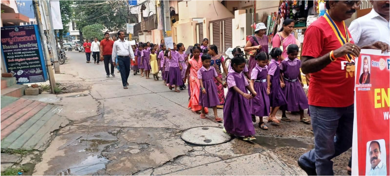
POLIO AWARENESS PROGRAM RALLY CONDUCTED AT KORETIPADU STREETS ON 24.10.2024 - WORLD POLIO DAY